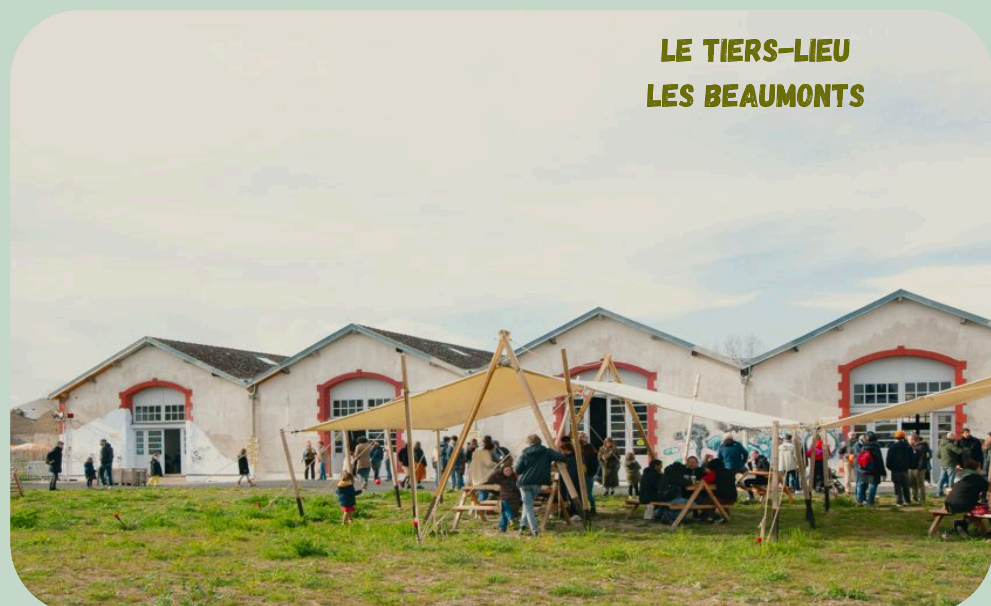
LE TIERS-LIEU LES BEAUMONTS