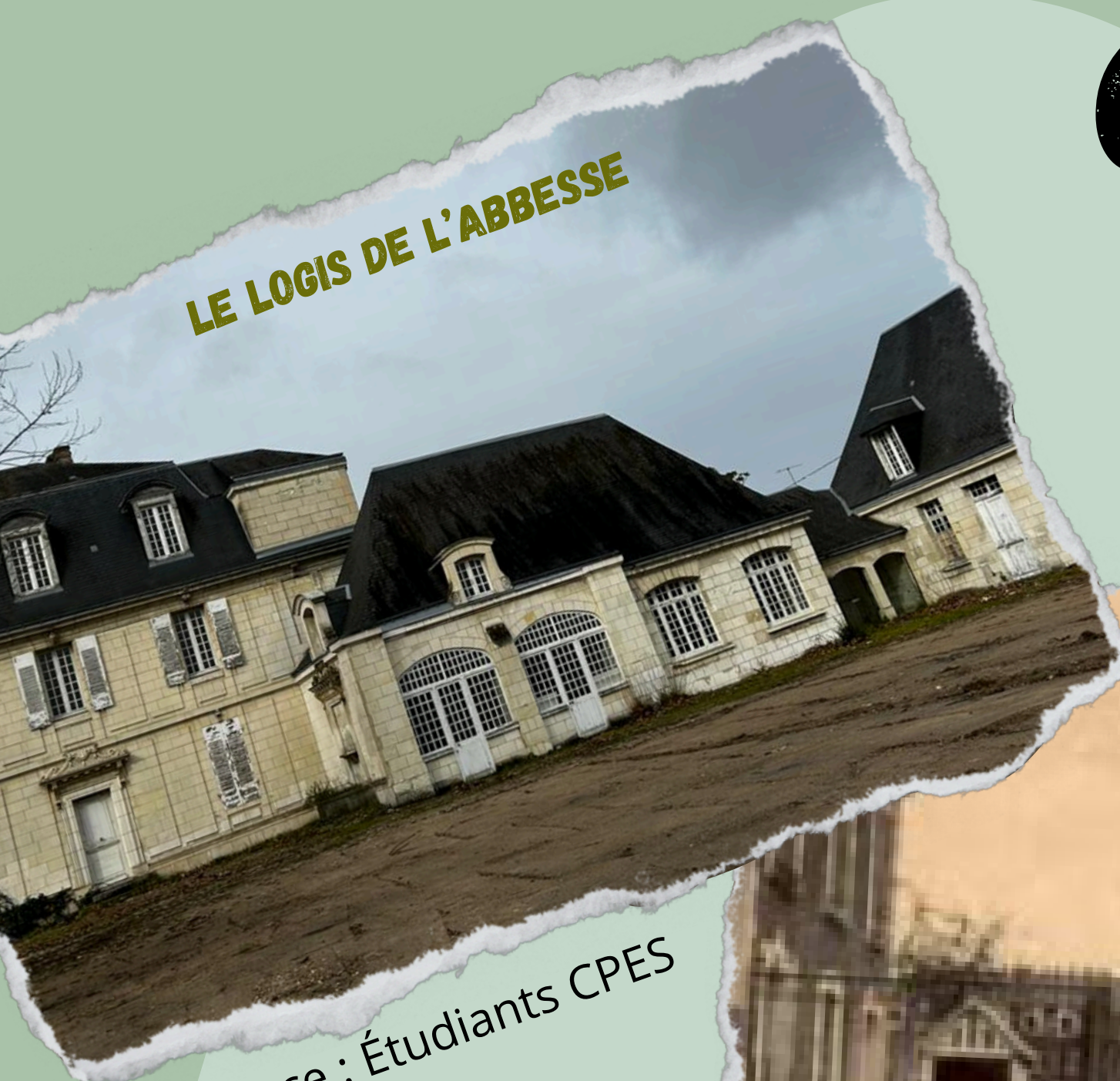
LE LOGIS DE L'ABBESSE