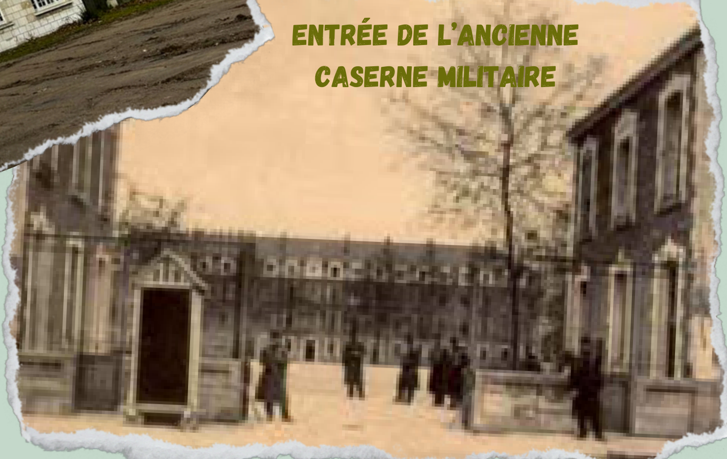
ENTRÉE DE L'ANCIENNE CASERNE MILITAIRE